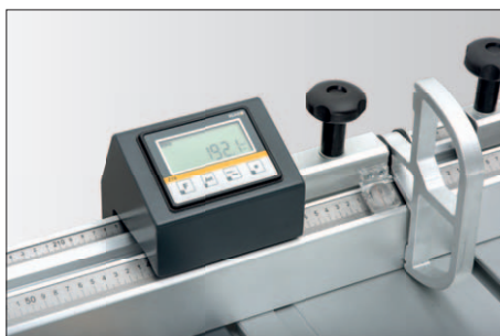
Cyfrowy wskaźnik pozycji przymiaru na ramieniu teleskopowym