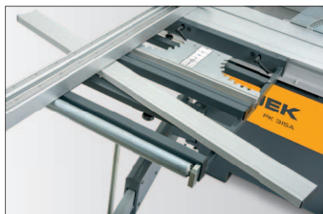
Rolka w stole na ramieniu teleskopowym Podporowy profil ramy