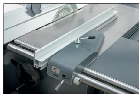
Przykładnica równoległa z podziałką mikrometryczną